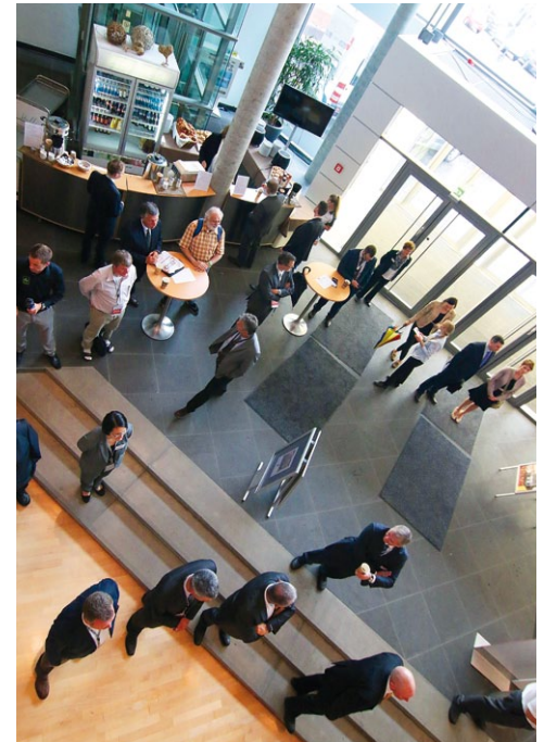
Konzept & Gestaltung: www.mainblick.de